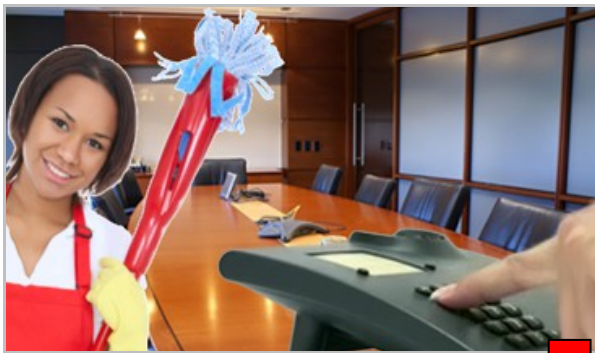
Votre intervenant, sur Site

Le logiciel identifie alors le site grâce au numéro appelant, et l'intervenant grâce au code personnel composé. SoftyCall peut être livré avec une application web de consultation des pointages, ou avec le logiciel SoftyPlanning (plusieurs options possibles).